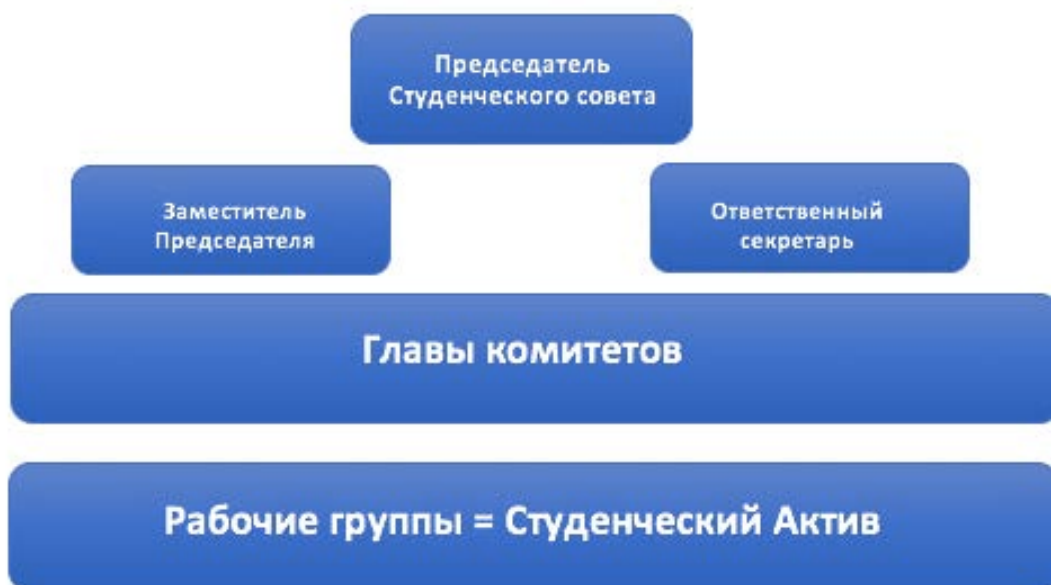
Рис. 1. Структура управления Студенческим Советом

Необходимо создать четкую структуру Студенческого совета с конкретными органами, которые выполняли бы конкретные задачи.